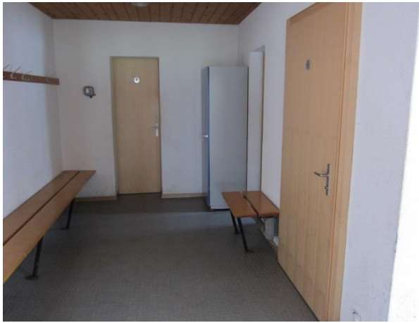
Vorraum / Eingang zu den Toiletten