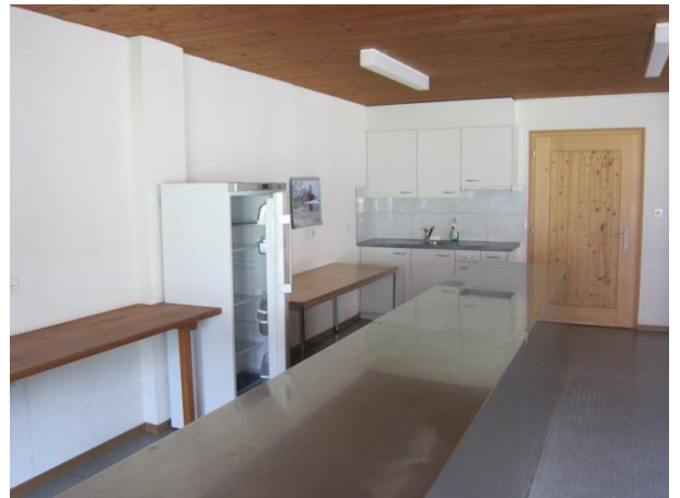
Buffet / Arbeitsflächen / Küchenkombination