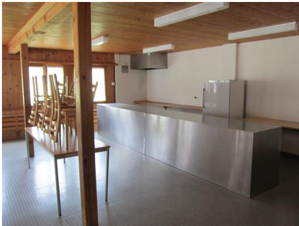
Aufenthaltsraum / Buffet / Kühlschrank