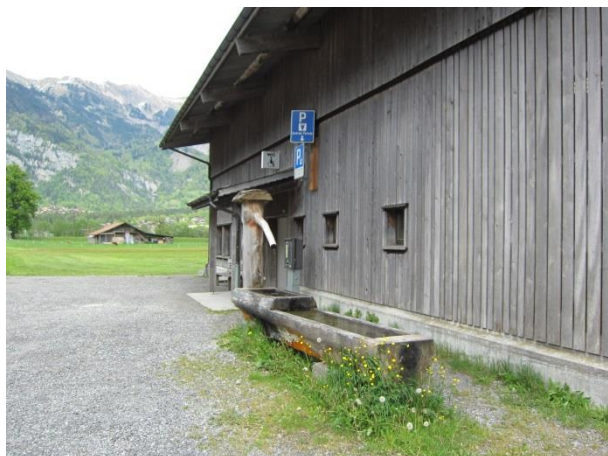
Blick Richtung See