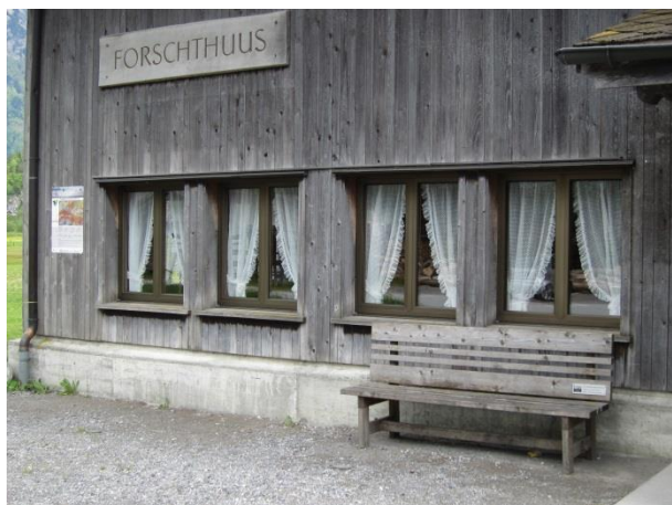
Vor dem Forsthaus